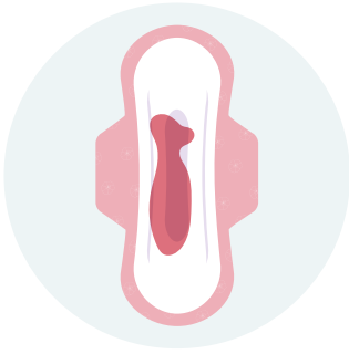
ምፍሳሰ ደም ማህጸን