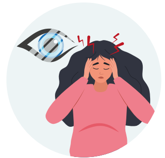
Cambios en la visión o dolores de cabeza

Como siempre, es importante conocer los movimientos de su bebé y prestar atención a cualquier cambio