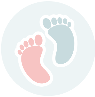
Redução ou alteração dos movimentos do bebê