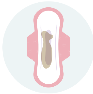
د افزاتو زیاتوالی، په ځانګړې توګه که دا اوبلن وي