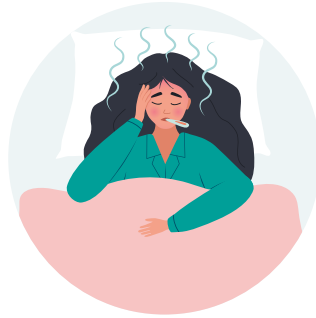
د ناروغی احساس وکړئ یا مو د تودوخي درجه (تبه) لوړه شي.