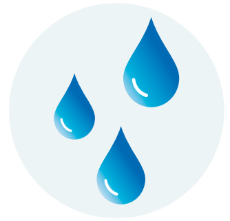
Rupture de la poche des eaux