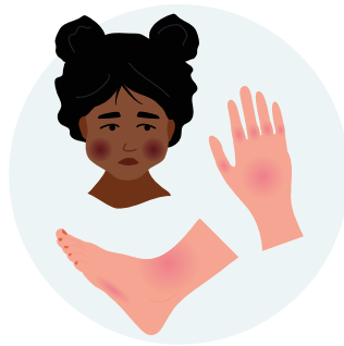
Gonflement des mains, des pieds ou du visage