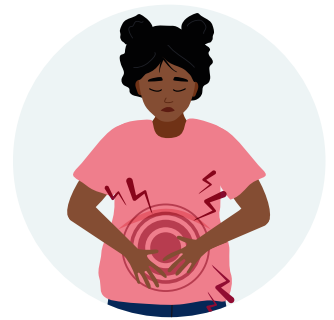
Douleurs dans le ventre, qui peuvent aller et venir ou être présentes en permanence