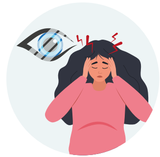
በእርስዎ እይታ ወይም ራስ ምታት ላይ ለውጦች

እንደ ሁልጊዜው የልጅዎን እንቅስቃሴ ማወቅ እና ማንኛውንም ለውጦች ማስተዋል አስፈላጊ ነው